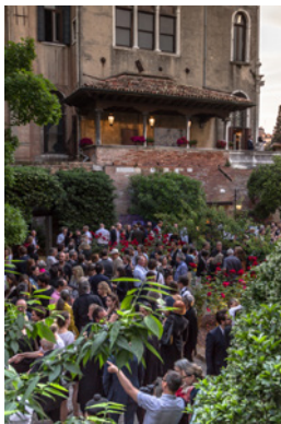
BP_Biennale_garten03.jpg BERÜHRUNGSPUNKTE Meetingpoint Garten am Canal Grande