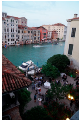
BP_Biennale_garten01.jpg BERÜHRUNGSPUNKTE Meetingpoint Garten am Canal Grande