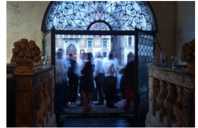
BP_biennale_steg.jpg BERÜHRUNGSPUNKTE Meetingpoint Steg zum Canal Grande