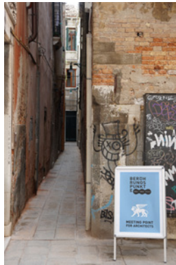
BP_biennale_eingang.jpg BERÜHRUNGSPUNKTE Meetingpoint Eingang zum Palazzo Contarini Polignac