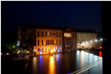
BP_biennale_palazzo04.jpg BERÜHRUNGSPUNKTE Meetingpoint für Architekt:innen im Palazzo Contarini Polignac