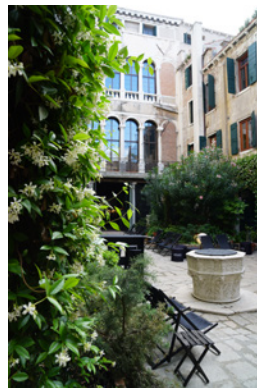
BP_Biennale_innenhof01.jpg BERÜHRUNGSPUNKTE Meetingpoint Innenhof Palazzo Contarini Polignac