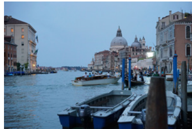
Venedig_stimmung02.jpg Stimmung am Canal Grande