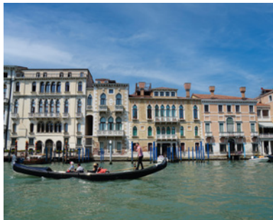
Venedig_stimmung01.jpg Stimmung am Canal Grande