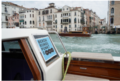
BP_biennale_taxishuttle.jpg BERÜHRUNGSPUNKTE Taxishuttle zwischen Meetingpoint und Biennale Gelände