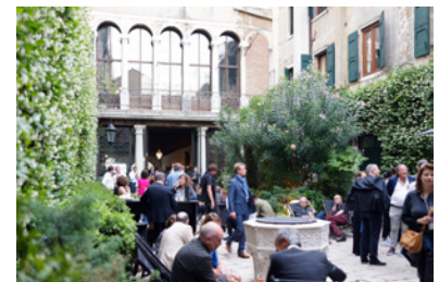
BP_Biennale_innenhof02.jpg BERÜHRUNGSPUNKTE Meetingpoint Innenhof Palazzo Contarini Polignac