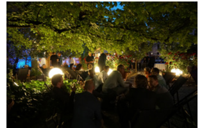
BP_Biennale_garten02.jpg BERÜHRUNGSPUNKTE Meetingpoint Garten am Canal Grande