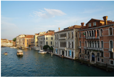
BP_biennale_palazzo01.jpg BERÜHRUNGSPUNKTE Meetingpoint für Architekt:innen im Palazzo Contarini Polignac