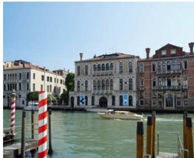
BP_biennale_palazzo02.jpg BERÜHRUNGSPUNKTE Meetingpoint für Architekt:innen im Palazzo Contarini Polignac